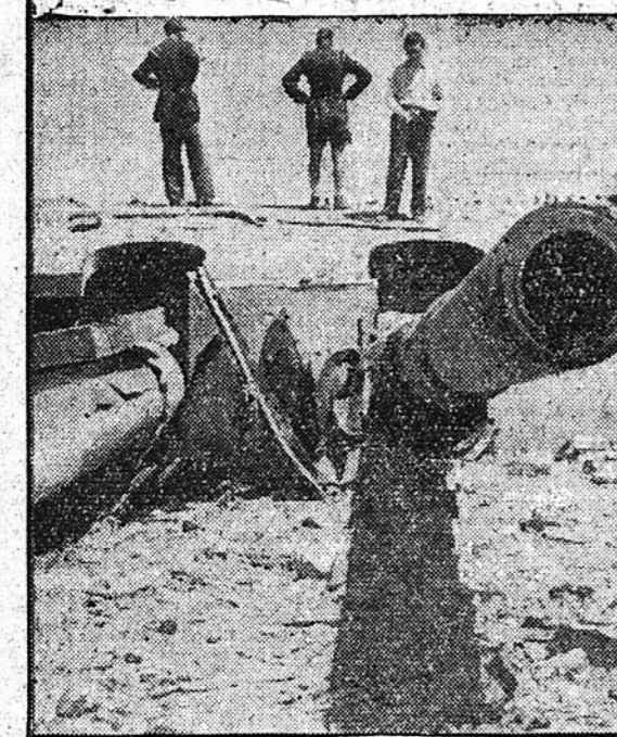
EXCLUSIVITES « LE MATIN ». — Nos photos représentent, en haut : le maréchal Manstein au côté de qui se tient notre envoyé spécial. Ci-dessus, de haut en bas, une statue de Lénine jetée bas et les plus gros canons de Sébastopol.